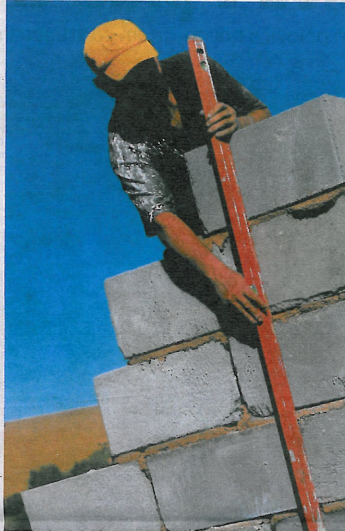
Nebyť nezamestnaný znamená ísť podnikať. ILLUSTRACNÉ FOTO - ČTK

Konzultant spoločnosti Centire Luboš Lehoťan si myslí, že