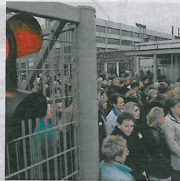
Z Maďarska sa vrátilo menej ľudí ako z Čiech a Británie. ILLUSTRACNÉ FOTO