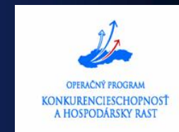
Schéma na podporu zavádzania inovatívnych a vyspelých technológií v priemysle a službách (DM)