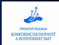
Schéma štátnej pomoci pre zvyšovanie energetickej efektívnosti na strane výroby aj spotreby a zavádzaní progresívnych technológií v energetike priamou formou pomoci