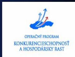
Schéma podpory pre začínajúcich podnikateľov (DM)